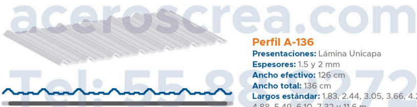
— Ancho efectivo: 126 cm — Ancho total: 136 cm